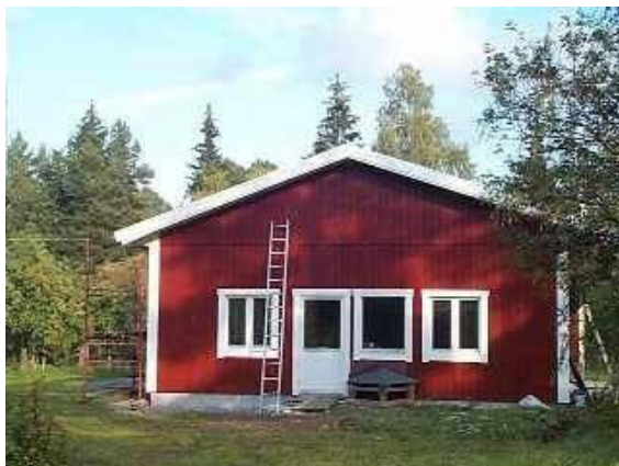
Fasad från väster under tillbyggnad 2000.