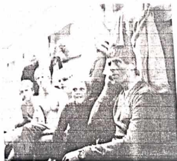
Även i herrarnas omklädningsrum är det hög aktivitet