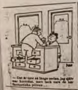
Det är inte så länge sedan, jag gick med kursen, men tack vare de här färdiga pilarna...