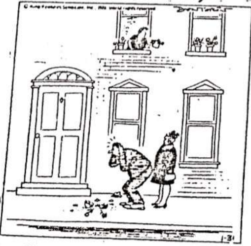
- Ta det inte så hårt, frun. Han råkar alltid ut för olyckor...

EKONOMI Inflationen är ett sätt att halvera sedeln utan att skada papperet.