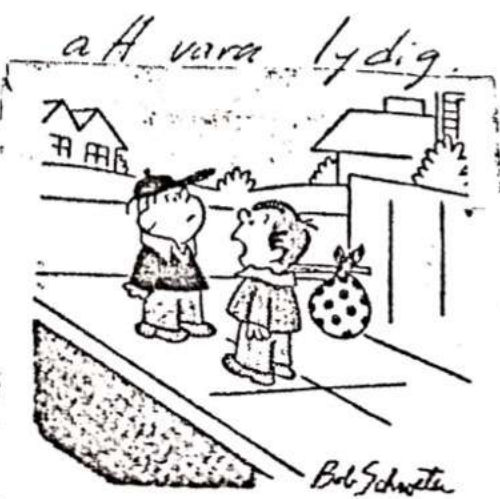
- Nu kan jag inte rymma längre. Jag får inte gå över gatan.