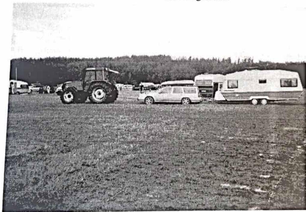
Fam. Boman på väg hem