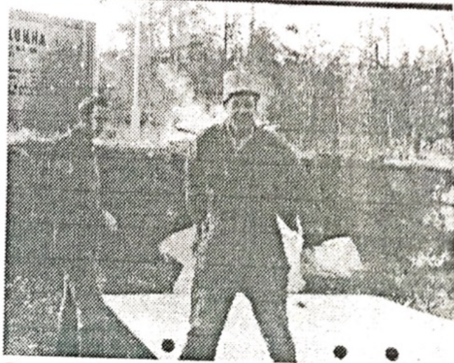
Rune Lord, för länge sedan.