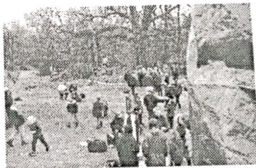
Vy över en liten bit av TC.