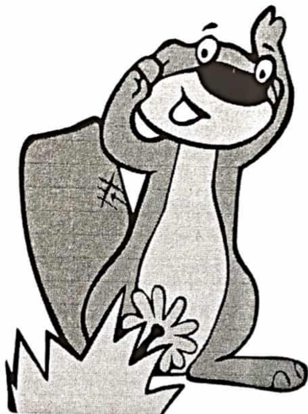
Viljan hade kombinationslag med OK Bävern.