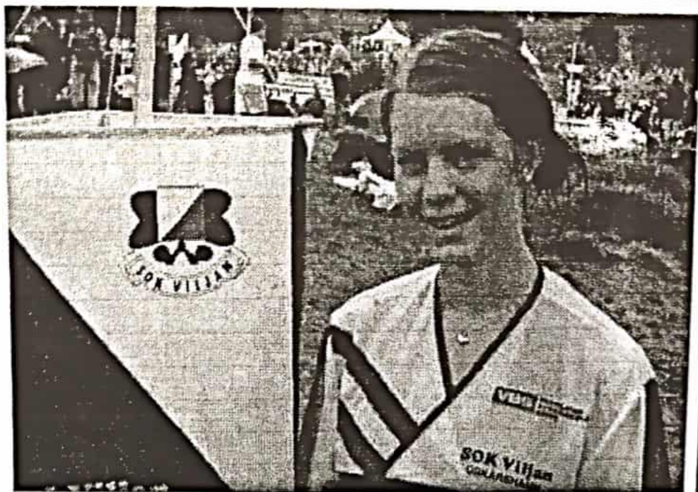
Jossan åker på Idreläget - med eller utan ledare!

När jag klev på bussen i Eksjö som skulle ta mig upp till Idre för ännu ett riksläger var jag till en början rädd. Inte för att alla som var inne i bussen såg farliga ut, tvärt om.