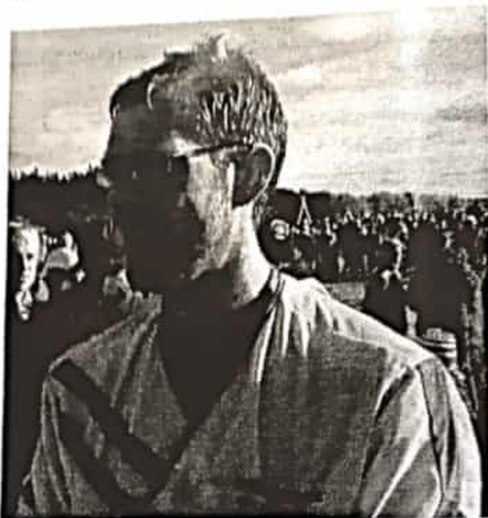
"Didden" förde Viljan till 53:e plats på sin sistasträcka.

mål. Ingen hade gjort någon större bom och vi blev 53:a! Därmed blev vi också näst bästa Smålandslag (efter IKHP som kom 5:a) och var bättre än tävlingens bästa andralag (Södertälje/Nykvarn igen som kom 54:a).