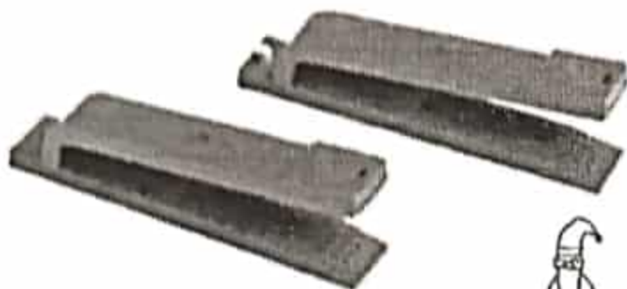
Smått nostalgiska stiftklämmor.

1) Stiftklämmor (väcker vissa nostalgikändor...)