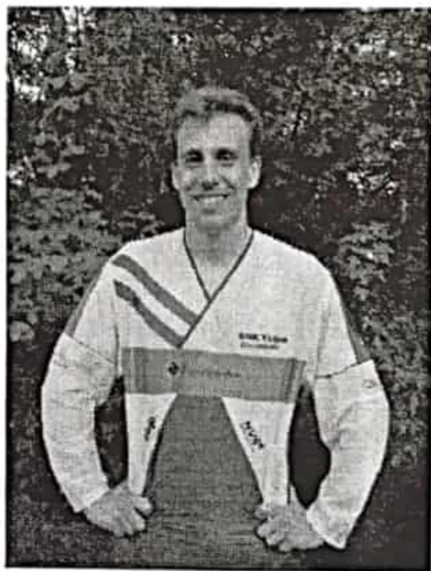
Varför slutar du innan du blir trött, Tord?