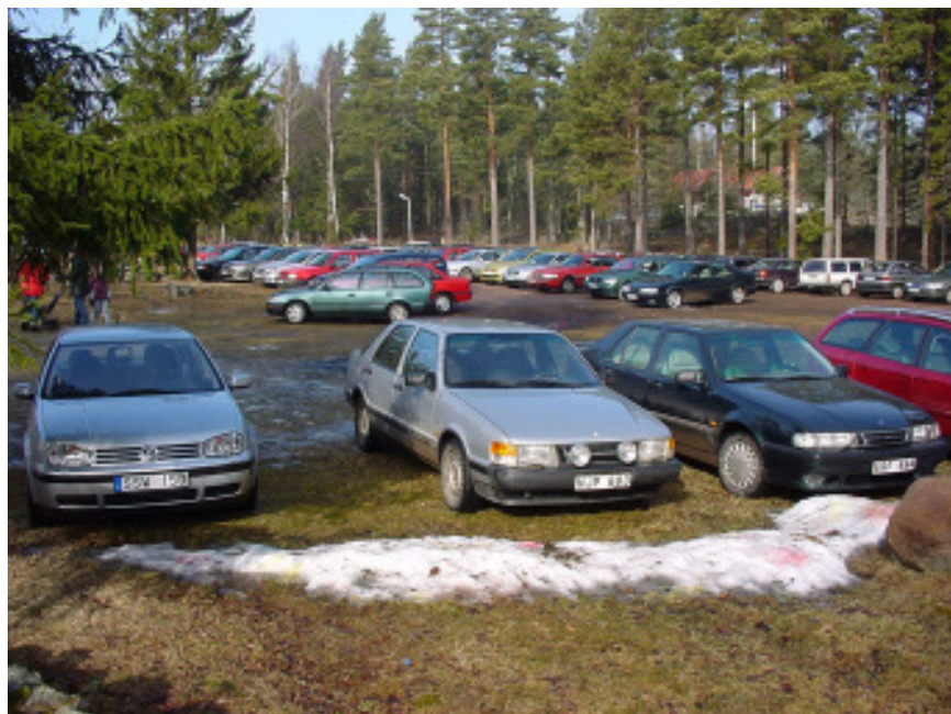
Parkeringen är alltid välfylld.