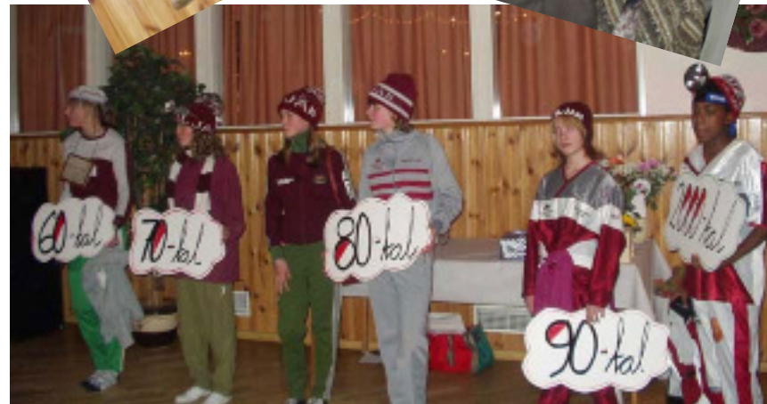
Ungdomarna visade Viljans klädsel från 60-talet fram till idag i en uppskaddad modevisning.