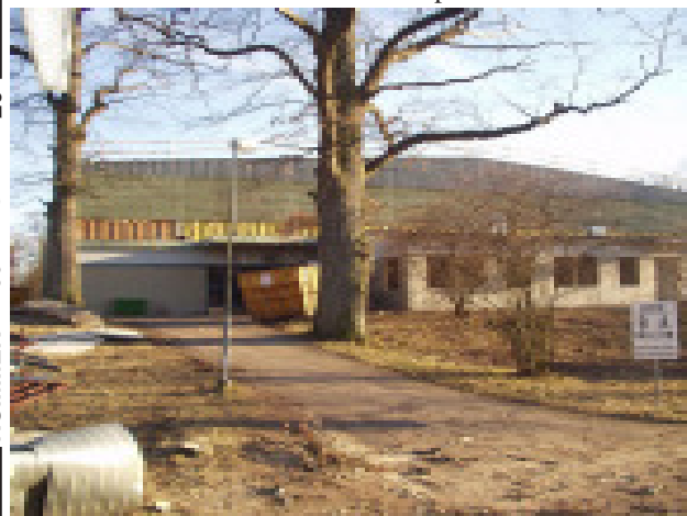
Ishallen byggs om - är det härifrån man ska få snö till Scantiaslingan? Det tror Ove.

SMS-tjänsten verkar ju fungera bra. Morgonen fortsätter med frukost, förmiddagsfika och ytterligare ett par PIP!PIP! Nya tider och passeringar på gång, vid frukost såg målet med att gå under 6 timmar kärvt ut men nu strax före lunchtid ser det ut att kunna gå med ganska stor marginal... Bäst att surfa ut på nätet också för att få den exakta starttiden 07.12, men har Ove verkligen inte startat förrän 12 minuter över första starttid – det måste ha hänt något?! Nu börjar det bli riktigt spännande... senaste SMS under lunchen pekar på en målgång 13.12, nu är det sekunder som gäller! Bäst att sätta på kaffe efter maten också. Det går åt mycket energi för oss på hemmaplan också. PIP!PIP! Du har ett meddelande: Ove Lernå beräknas gå i mål på tiden 5.57. PUH! Äntligen över för den här gången. Undras om han ska våga sig på riktiga Vasaloppet nästa gång...?