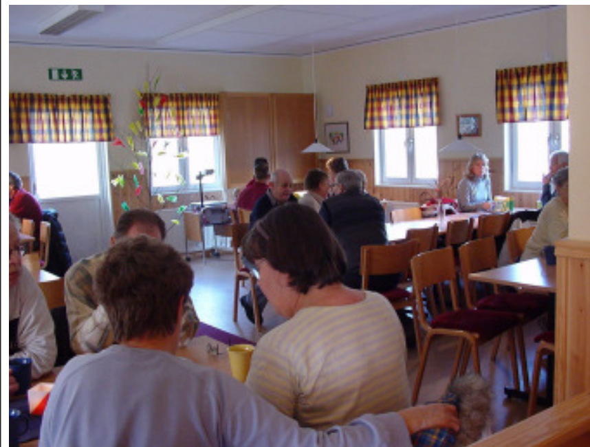
"..för fika efter tipset, det är nåt som alla vill!"