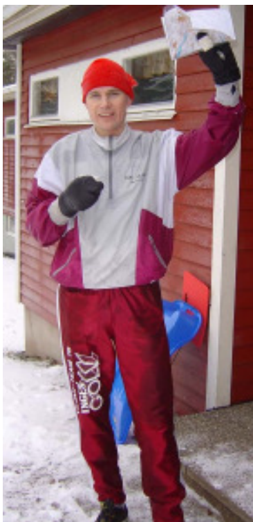
Långseger för Våge.

Jag fick idén att kontrollen kanske ändå satt på andra sidan ravinen och sprang över den och började leta. Hittade den dock inte direkt och så kom vi fyra som sprang och letade fram till att vi skulle