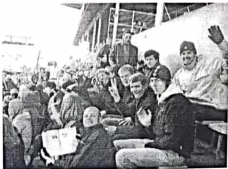
Glatt gäng på Råsunda.