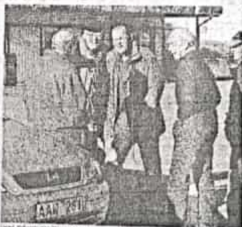
En bild som visar en grupp människor som står runt en bil. Bilden är en del av en artikel som handlar om en jakt efter guld och silver.

De två har varit på jakt eftersom de tror på guld. De har varit på jakt i ett ställe som ingen har varit på.