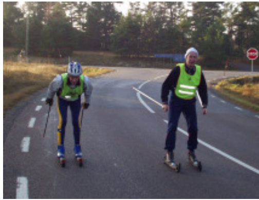
Skidsektionen har inte behövt åka på hjul i vinter...

Klubbmästerskapet kördes den 18 februari med ett 35-tal startande, se resultat här i Kampen.