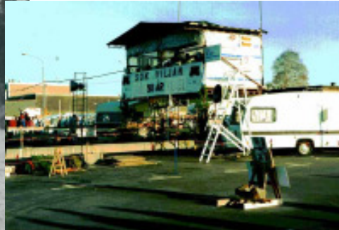
Måltribunen vid Smålandskavlen 1993, Scania Oskarshamn.