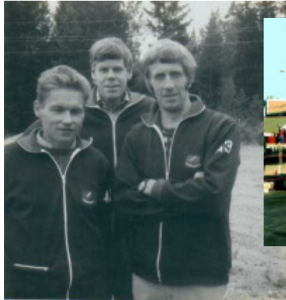
DM-budkavle 1974, seger i klass