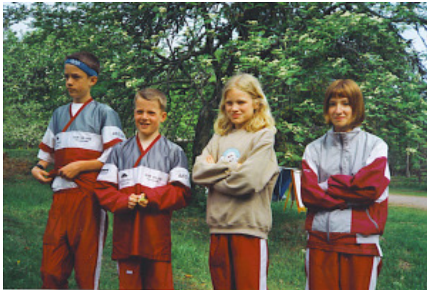
Läger vid klubbstugan 1999.