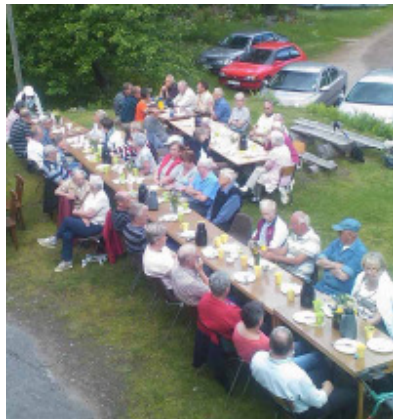
Ett 60-tal av veteranerna lät sig väl smaka vid våffelfesten dagarna före midsommar.