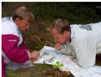
Vägvalsbekymmer i sommartider

Välkomna! Tävlingsledningen och Styrelsen