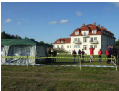
Nedan prispallen i H 55 och ovan hotellet mitt på TC. Längst upp kaffepaus.