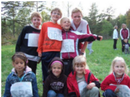
Lag 5 segrade i stafetten.