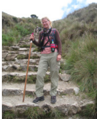
På väg ner från högsta punkten - många trappsteg blev det!