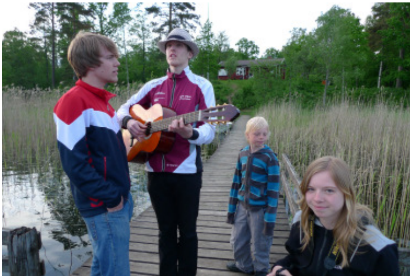
Juniorena stod för musikunderhållningen