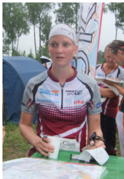
Frida vann också en etapp.