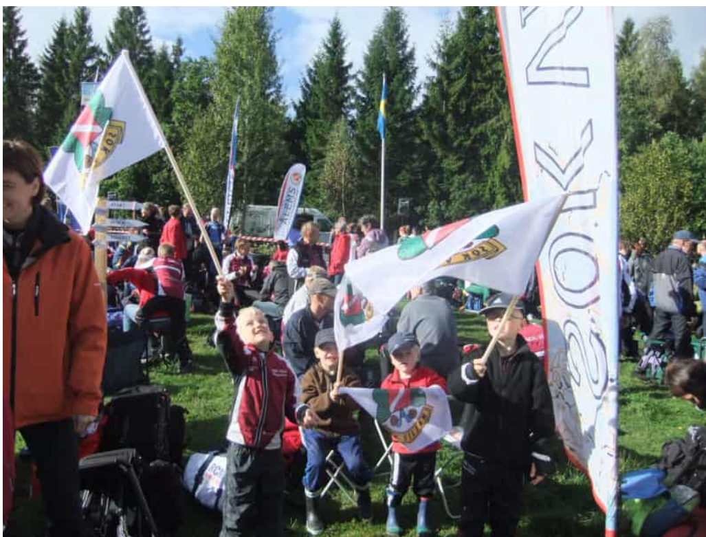
Vid Ålems DM långdistans invigdes klubbens nya flaggor och det viftades friskt, inte minst för att fira att klubben var näst bäst i Småland den här dagen.

Året 2010 har varit helt otroligt vad gäller ungdomsverksamheten. Vi snittade i våras 70 stycken barn och ungdomar på tisdagarna, en otrolig siffra. Det är många klubbar som inte ens drömmer om de deltagarsiffrorna. Utöver det så blev vi utnämnda till årets kometklubb på ungdomssidan, efter att varit nästa bästa ungdomsklubb på dag-DM. Smålands orienteringsförbund har under hösten utvärderat en enkät om hur olika klubbar bedriver ungdomsverksamhet och Viljan valdes ut som ett bra exempel på klubbar som har lyckats. Vad gör då att en klubb lyckas? Man spaltade upp ett antal punkter: