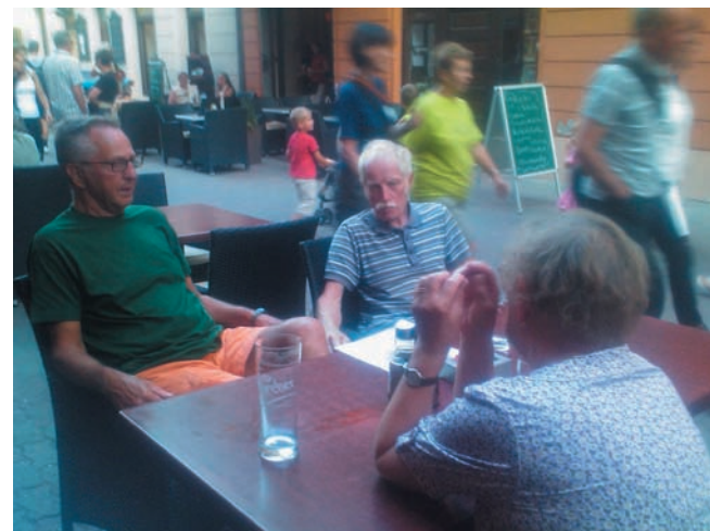
Coca-cola-paus i Péch.