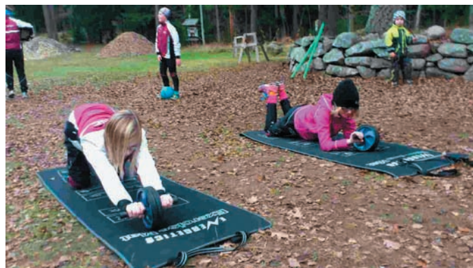
Skidsektionen körde under hösten igång barmarksträning vid stugan med bl a stavgång och olika styrkeövningar.

Nu hoppas vi på vinter så att vi får nytta av vårt slit i tunneln.