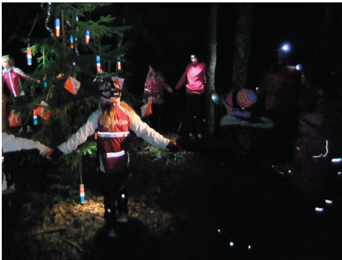
Julgransraskningen vid stugan hölls utomhus med en levande gran fylld med skärmar och nattreflexer.