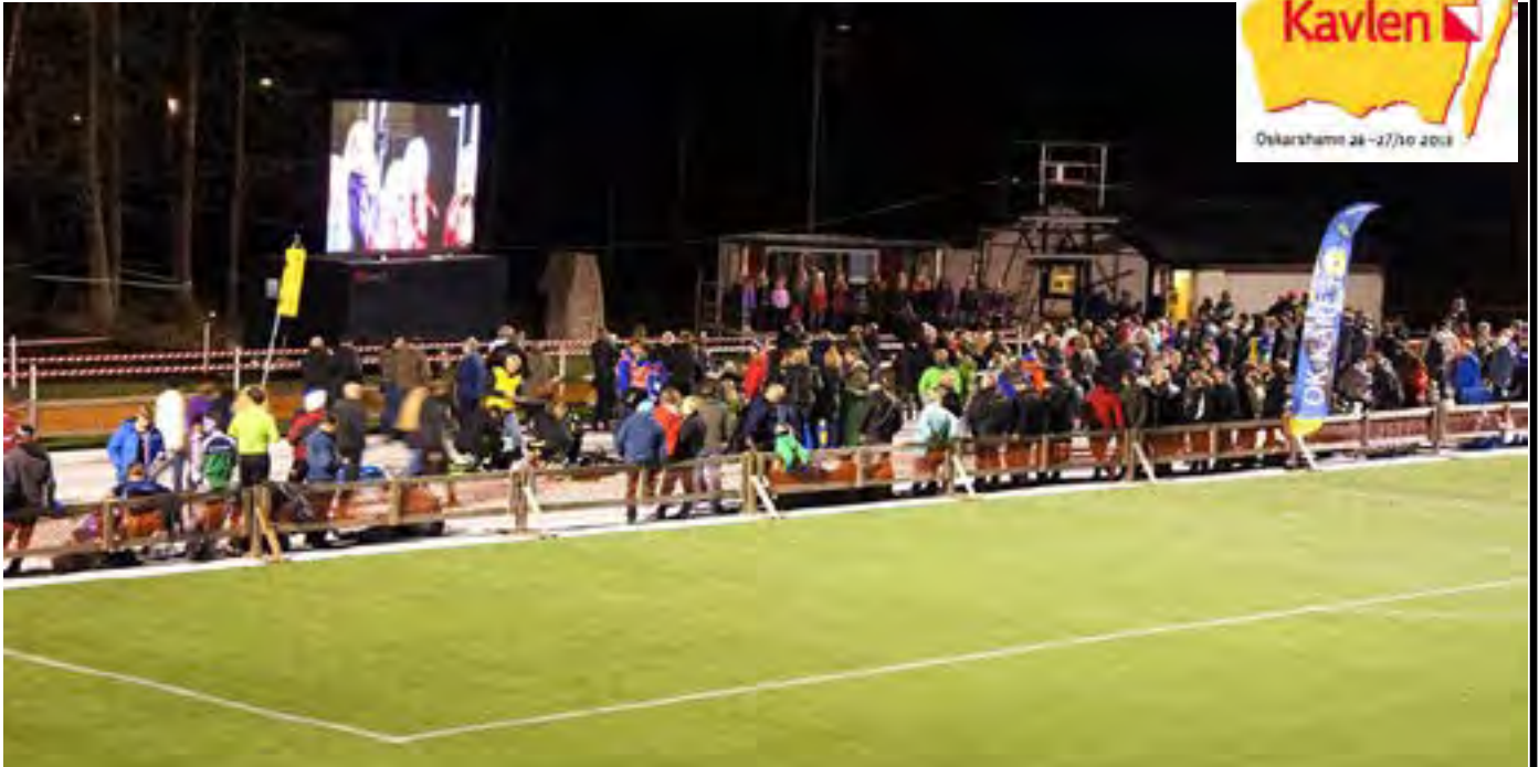
Arenabelysning på lördagskvällen över konstgräs och storbild. Nedan Röda Korset i aktion med en del skador till följd av hala berghällar bl a.