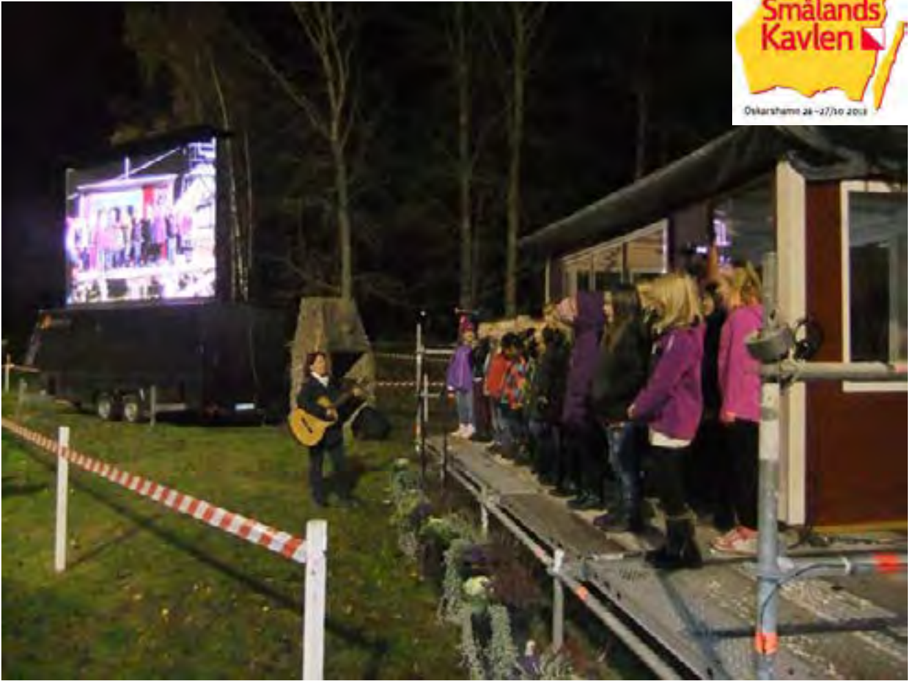
En barnkör från Döderhult sjöng vackert på invigningen. Nedan, mera mat i markan.