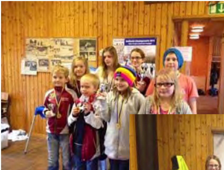
Under vinterns supercup hade Viljan många ungdomar med som hämtade hem medaljer.