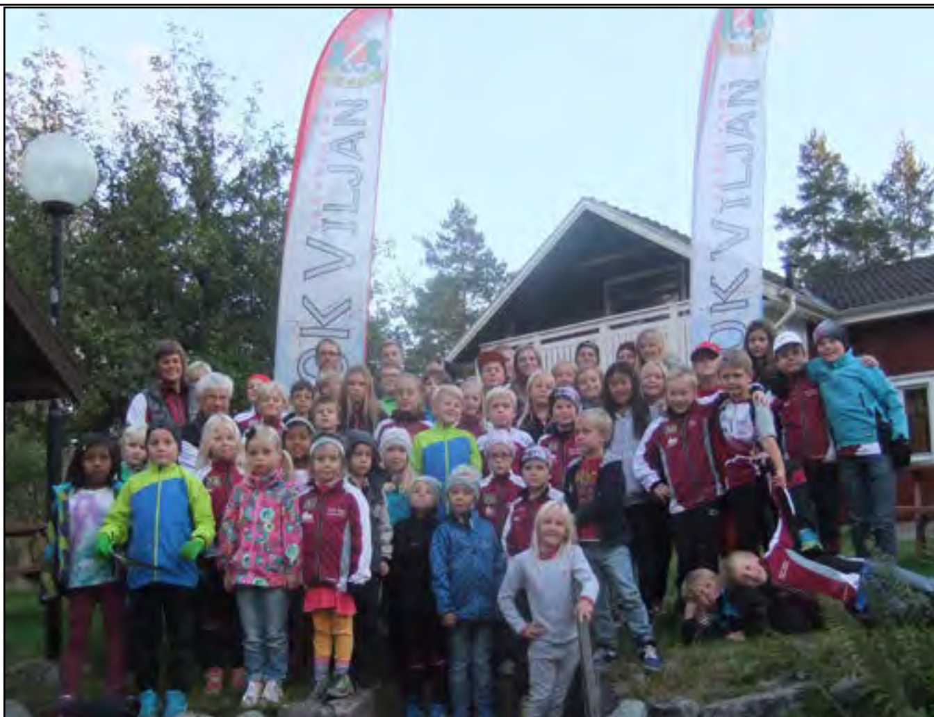
Jättemånga ungdomar och ledare samlade vid höstens ungdomsavslutning. Till höger gul grupp och nedan grön grupp. Fortsättning på nästa sida.