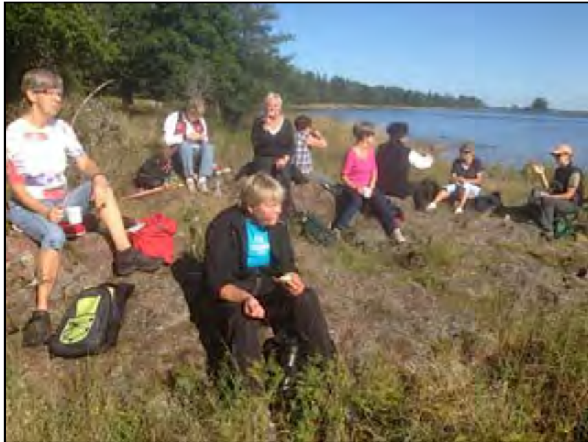
Ovan fikar damveteranerna under en vandring vid Emån. Nedan den som vanligt välbesökta våffelfesten vid klubbstugan.