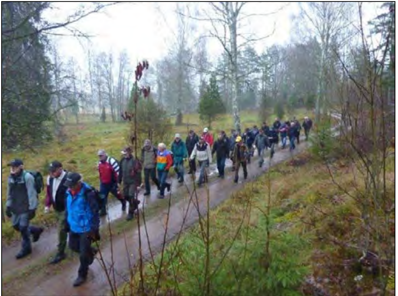
Ovan 33 vetera- ner på vandring mellan Äshult och Smältebro. Till höger fyller man på med lite kalorier vid det årliga julbordet i Mysingsö.