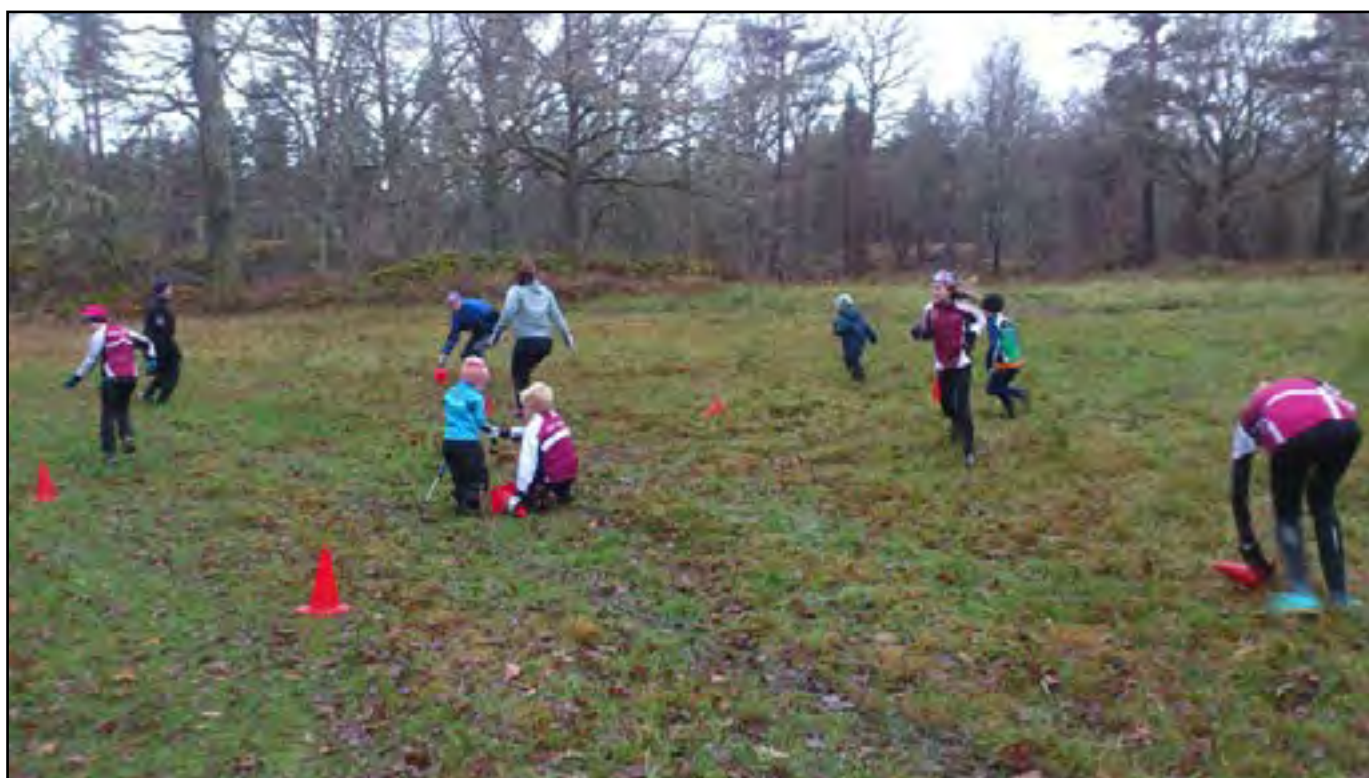
Försäsong för skidåkarna med barmarksträning vid klubbstugan på lördagar och rullskidträning vid Kikebo på söndagar.