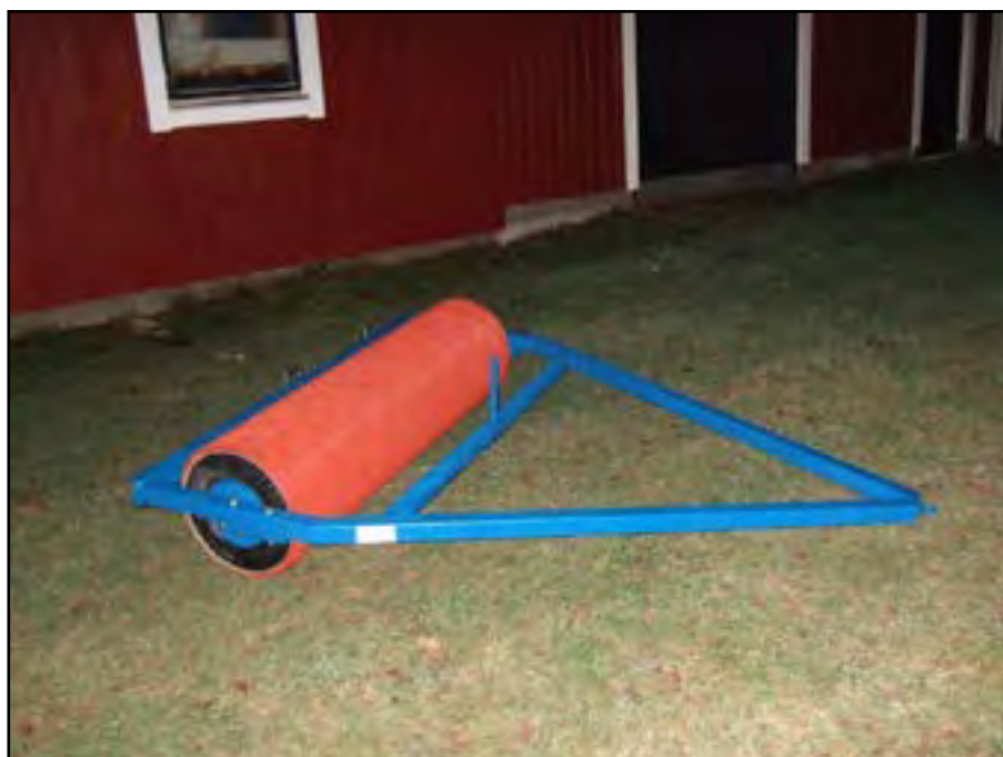
Ovan årets nyförvärv, skaterullen, nedan Våges önskeklapp från tomten.