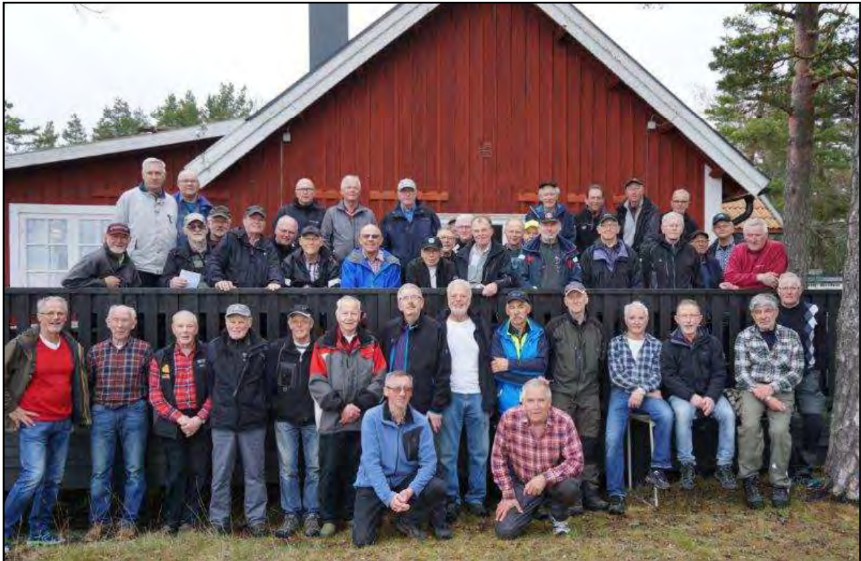
Ovan den traditionella bilden i samband med vandring och lunch på Aboda Klint. Nedan en naturskön fika på långvandringen på Ostkustleden vid Granholmsfjärden.