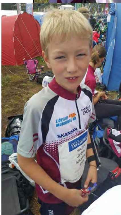
2 X 10 år