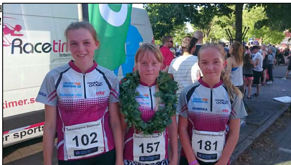
Segerkranen på artikelförfattaren.