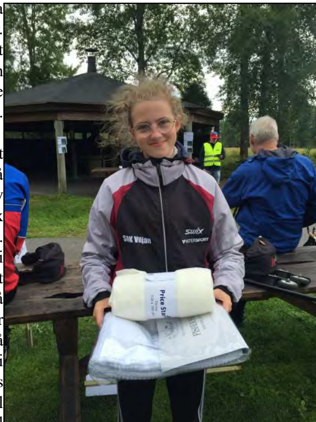
Artikelförfattaren på DM i rullskidor