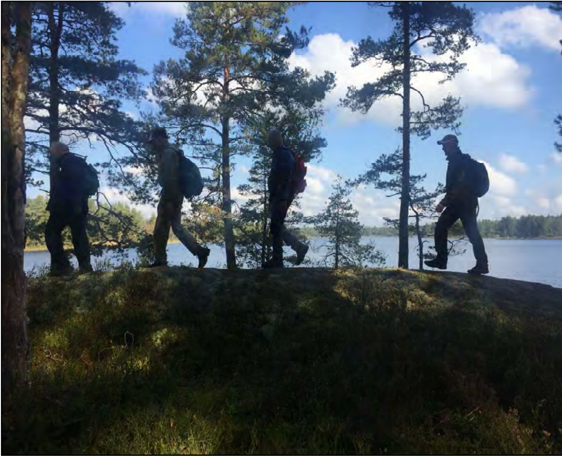
Ovan vandring vid Försjön norr om Fliseryd i september och nedan fika vid Smedjan under höstens långvandring på Krokshultsleden.