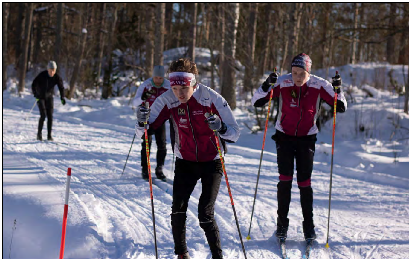
Bilder från en solig vinterdag med skidåkning vid Viljans stuga.