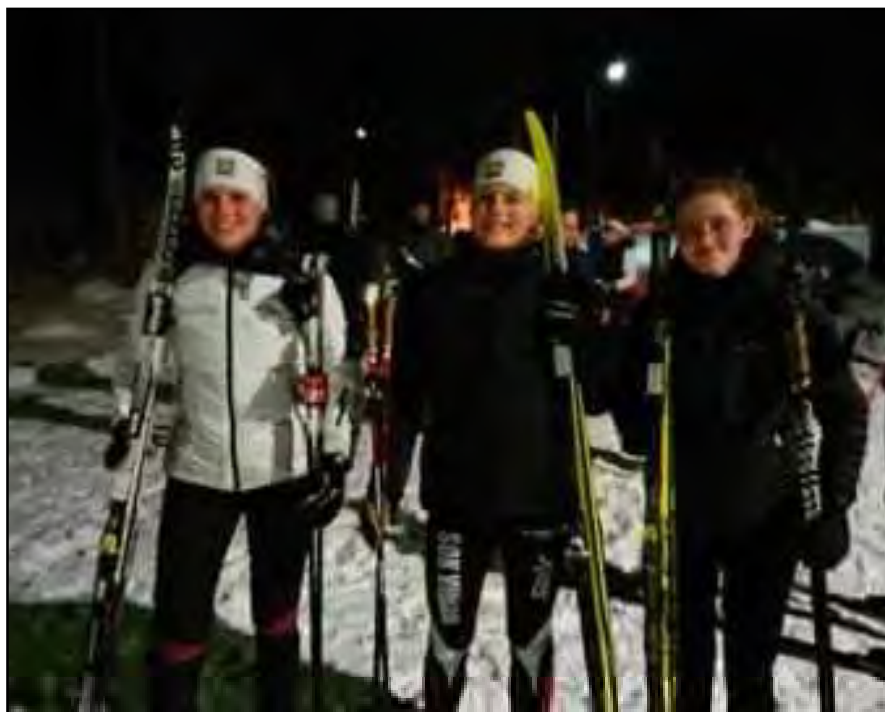
Ovan från skid-KM i Havslätt och nedan från Barnens Vasalopp vid stugan.