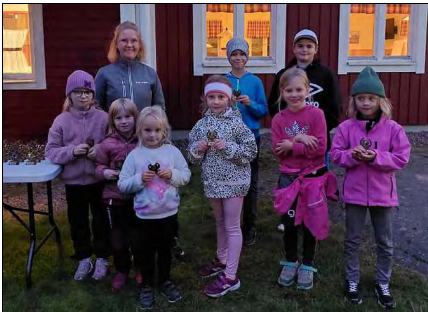
Ovan inskolningsgruppen och nedan tävlingsgruppen.