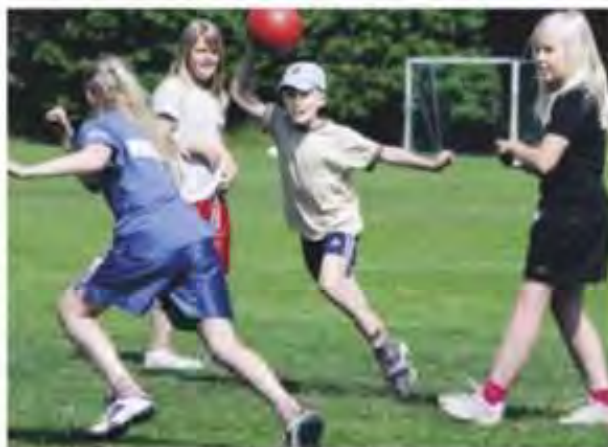
Jägarboll är alltid ett säkert kort på OSK:s friidrottsskola.

– Det har funkat bra att vara här. Och vi har verkligen haft tur med vädret, det har ju varit