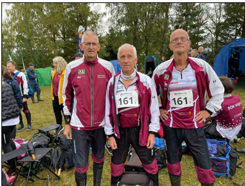
DM-guld i stafett i H 65.