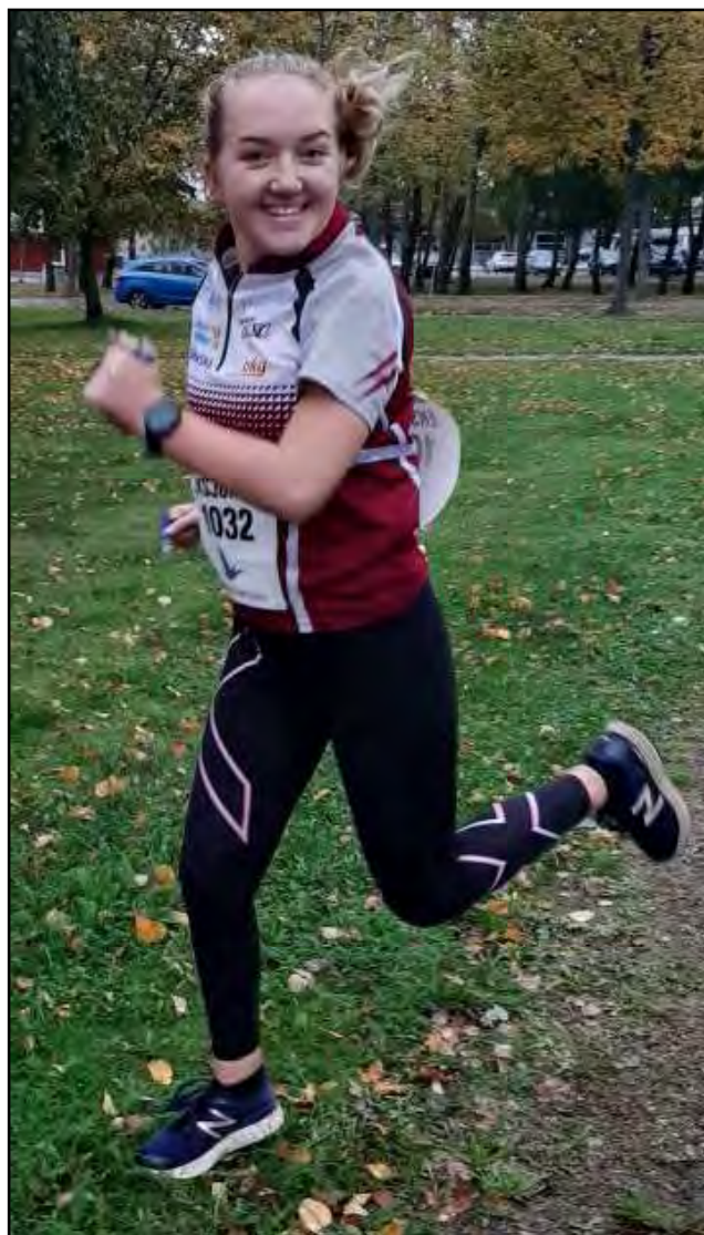
Tuva 20 år