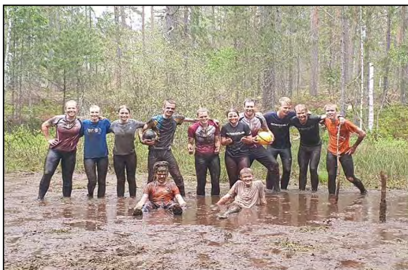
Vårens höjdpunkt är mossfotbollen i ett härligt lerigt kärr i närheten av klubbstugan