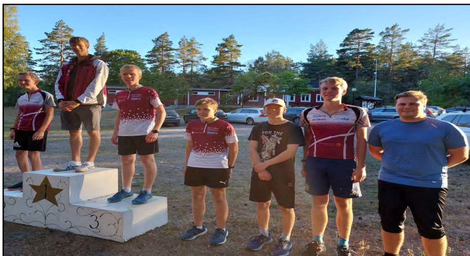
Ovan de bästa herrarna i terräng-KM i augusti. Nedan ungdomarna som åkte till Daladubbeln strax innan Kampens stoppdatum.