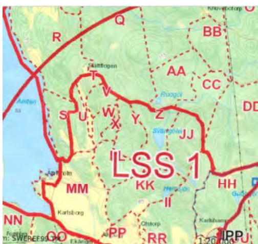
Tilldelad karta med utritade sökområden enligt EFT metoden. Tilldelade områden AA, BB, CC samt omgruppering till II.

Tilldelade kartor höll inte måttet för eftersök i terräng, men som tur var fanns mobiltäckning så det blev kartor hämtade till mobilerna som vi använde.