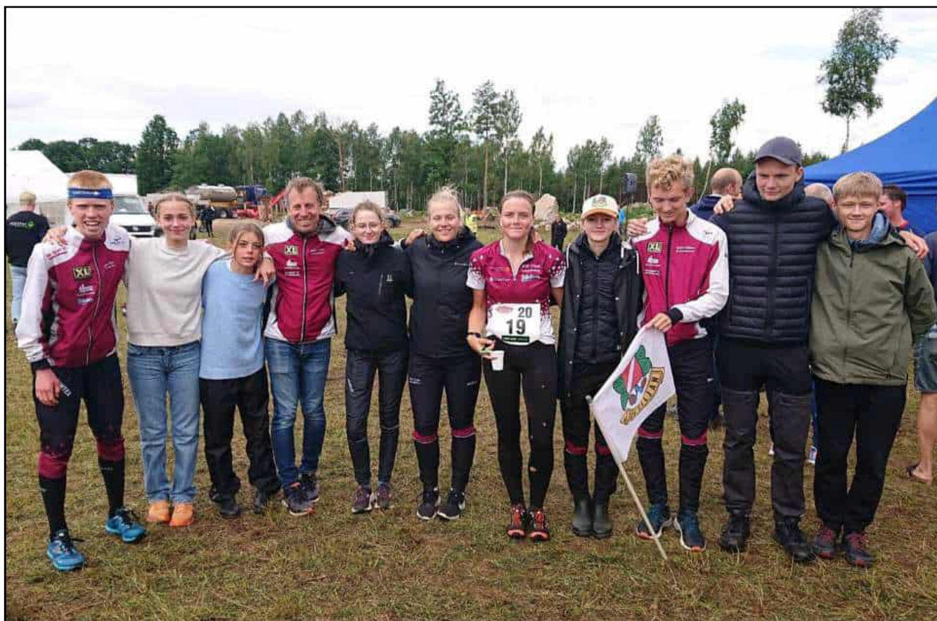
Ovan delar av de två Tjoget-lagen där förstalaget blev 9:a. Nedan dam- respektive herrlag på Jukola.