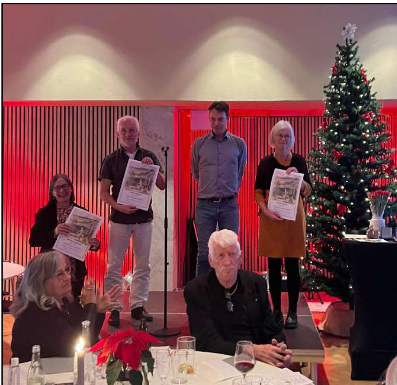
Utmärkelser från förbunden. Ovan SOFT:s diplom, nedan Smålands OF:s silvermedalj.