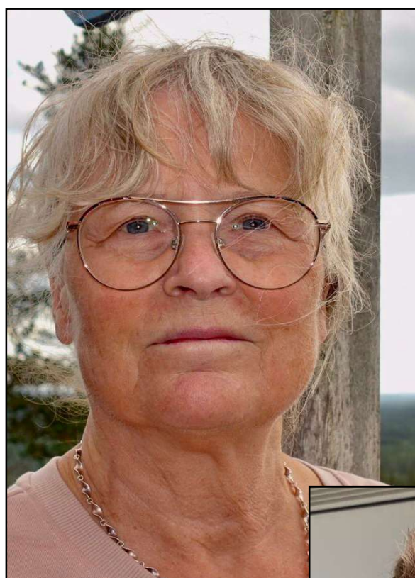
Guje 70 år